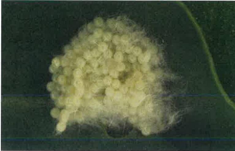
秋行軍蟲卵