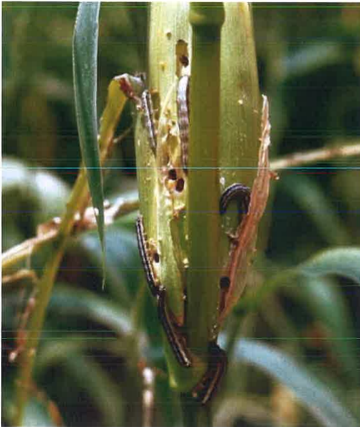
秋行軍蟲幼蟲危害玉米果穗(University of Georgia_CC BY-NC)