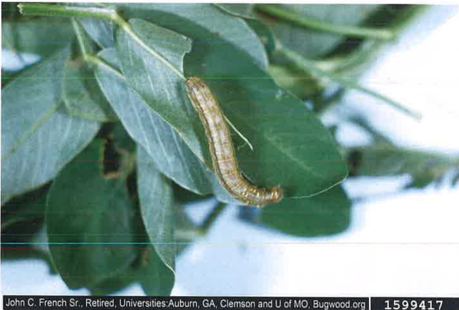
秋行軍蟲危害高粱

John C. French Sr., Retired, Universities Auburn, GA, Clemson and U of MO, Bugwood.org 1599417