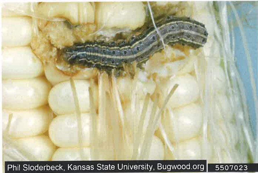
秋行軍蟲危害玉米粒