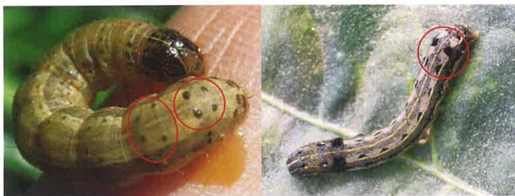
秋行軍蟲（左）及斜紋夜蛾幼蟲區別