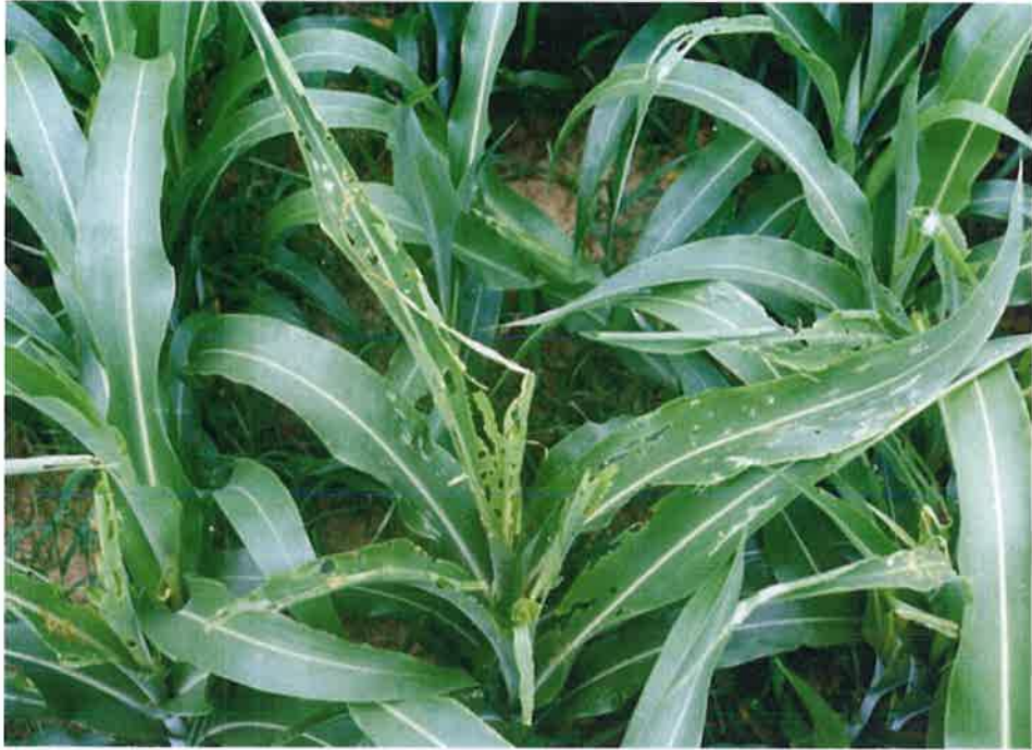
秋行軍蟲幼蟲在高粱葉片上危害狀