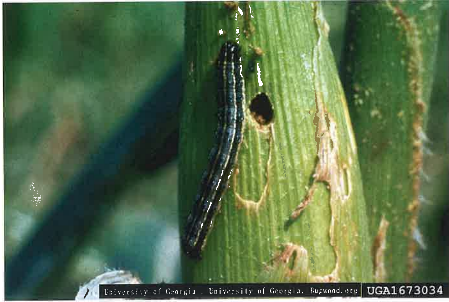
秋行軍蟲危害玉米果穗