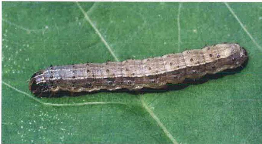
在棉花作物上的秋行軍蟲幼蟲

秋行軍蟲之幼蟲具 6 個齡期，各齡期頭殼平均寬度分別為 0.35、0.45、0.75、1.3、2.0 及 2.6 mm，一至六齡之蟲體平均體長為 1.7、3.5、6.4、10.0、17.2 及 34.2 mm。一齡蟲之體色呈綠色並帶有黑色頭殼；二齡體色逐漸轉為橘色；三齡體呈褐色且有白色側線 (lateral line)；四至六齡期，頭部為紅棕色帶有些許白色網紋，體呈褐色並具有白色的背部和側線，背部出現黑色斑點並且有刺 (spines)，胸部與腹部每一體節背方具 4 個黑色疣突 (verrucae)，腹部倒數第二節之疣突呈矩形排列，其餘體節斑點排列呈梯形，成熟幼蟲之頭殼可見一淺黃色倒 Y 形頭縫線，兩側額區呈黑褐色具有淺色斑點。