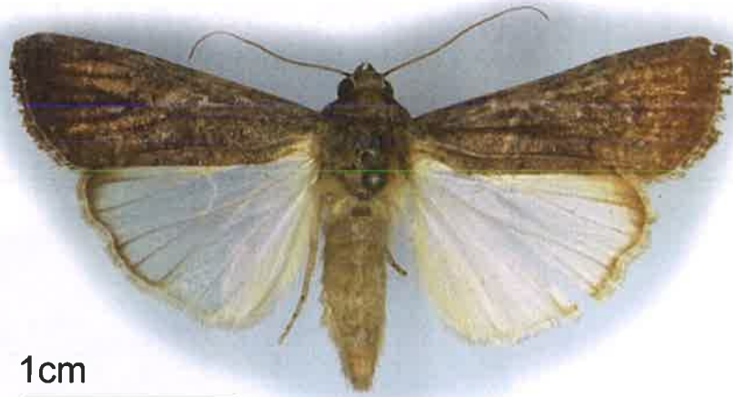
秋行軍蟲雄成蟲