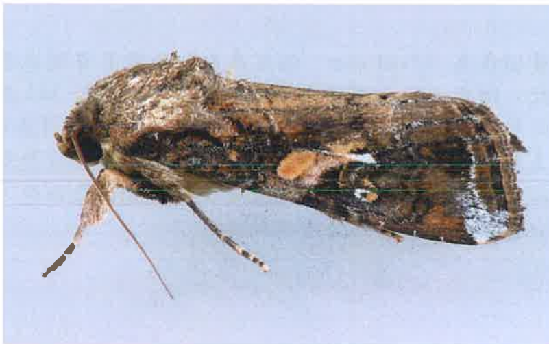
秋行軍蟲雄成蟲